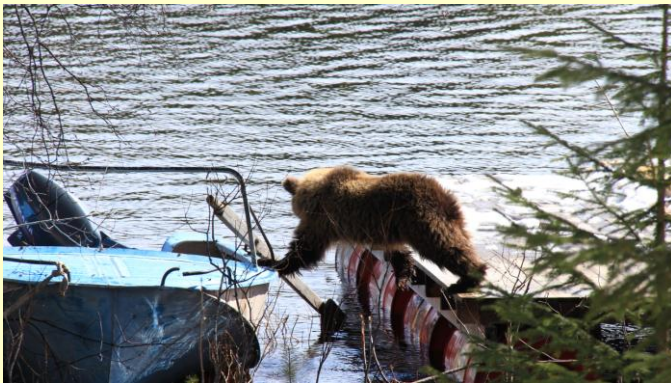
Ourson à la sortie de sa tanière

Adresse : Village Voknavolok, République de Carélie, RUSSIE